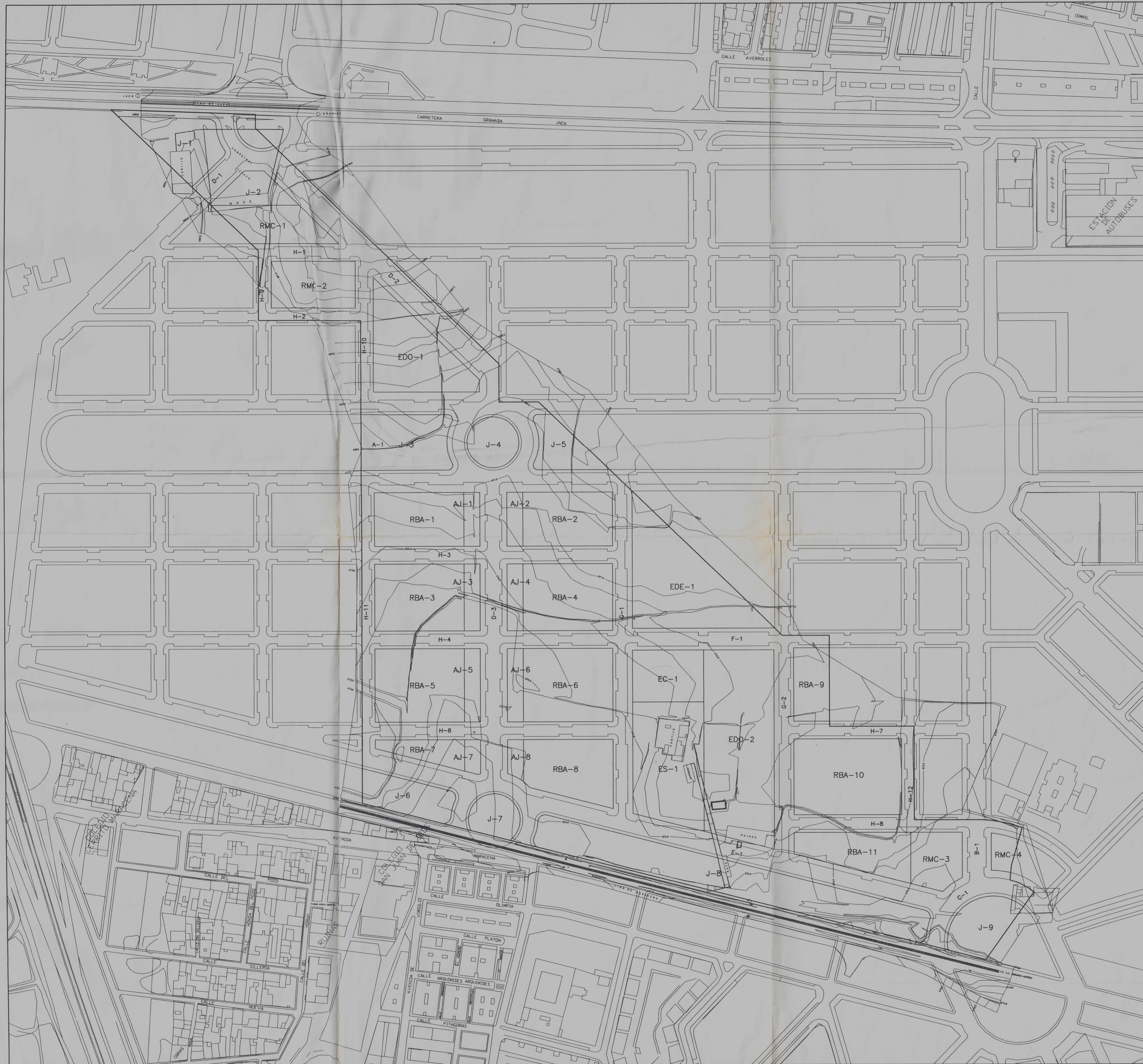
CUADRO DE CARACTERISTICAS DE LAS UNIDADES BASICAS O MANZANAS