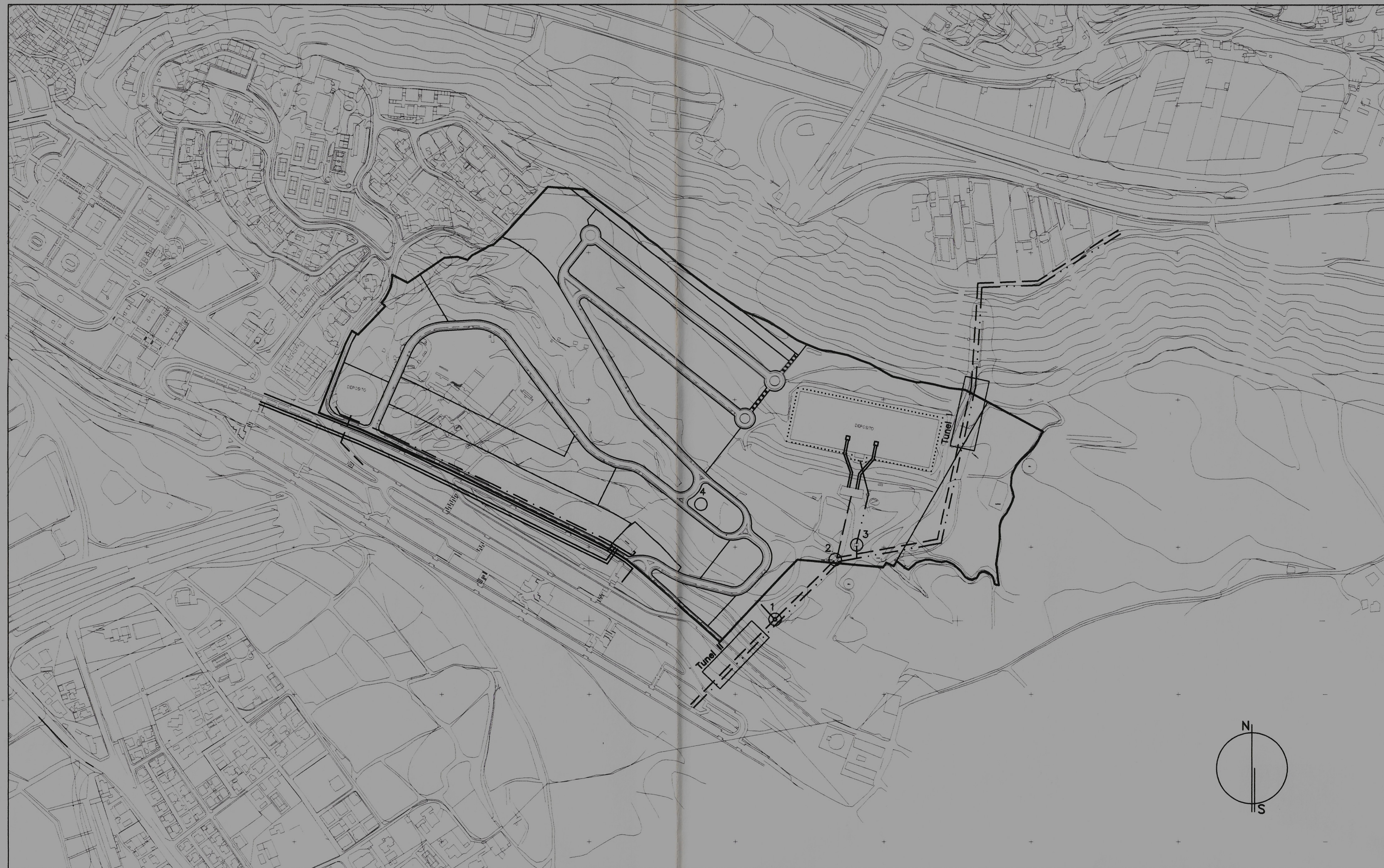
ABASTECIMIENTO DE AGUA