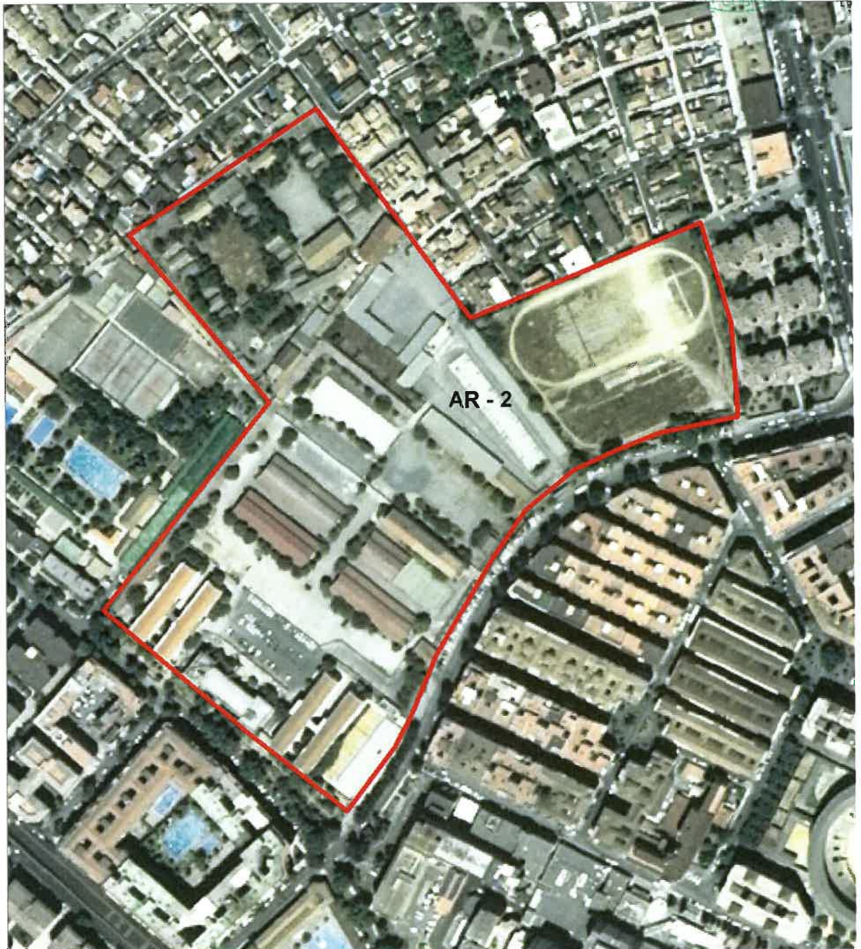
Delimitación del AR 7.02 Mondragones

Aprobado DEFINITIVAMENTE por el Excmo. Ayunmto. Pleno en sesión de fecha.